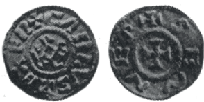
Denier de Charlemagne

Voc. : performance (f.) : Leistung ; exploit (m.) : Leistung